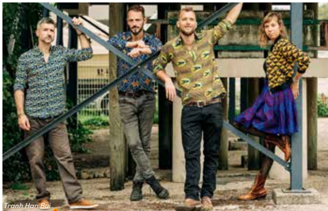
Tranh Han Bui